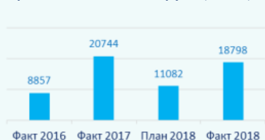
Производительность труда (тыс.тг.)