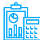
ДОХОДЫ АО «НИТ» за 2018 год В РАЗРЕЗЕ УСЛУГ